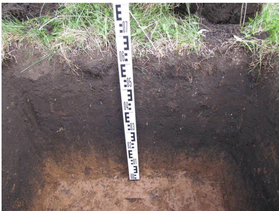
Рис. 8. Шурф № 1. Север- ная стенка.