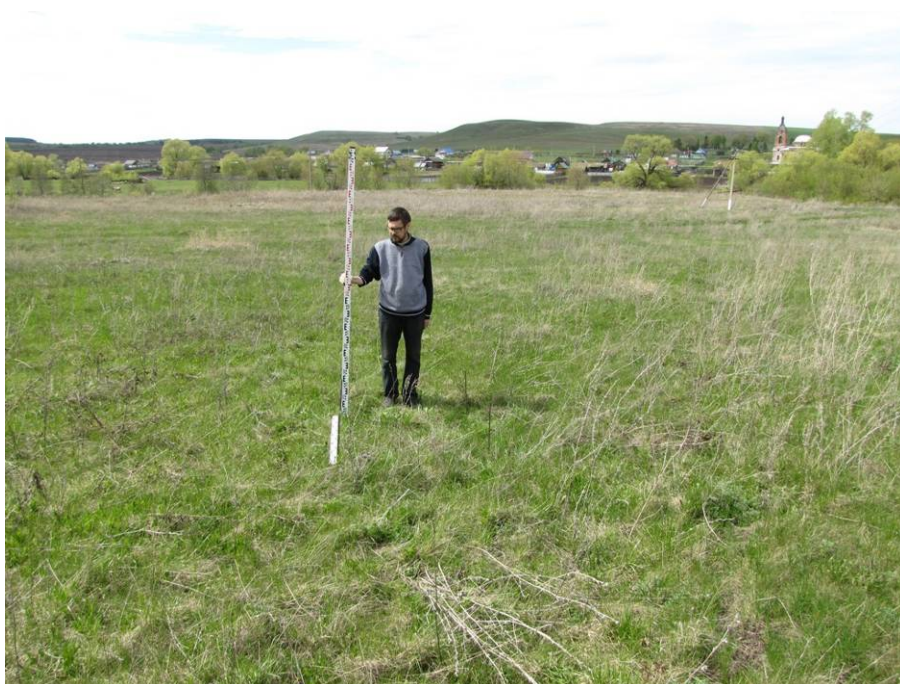
Рис. 7. Шурф № 1. Место заложения в районе проек- тируемого мостового пере- хода, на задернованной по- верхности первой надпой- менной террасы левого бе- рега реки Налимка. Вид с востока.