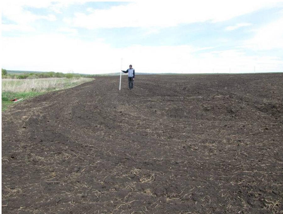
Рис. 6. Обследование па- шен на поверхности первой надпойменной террасы ле- вого берега реки Налимка. Вид с запада.