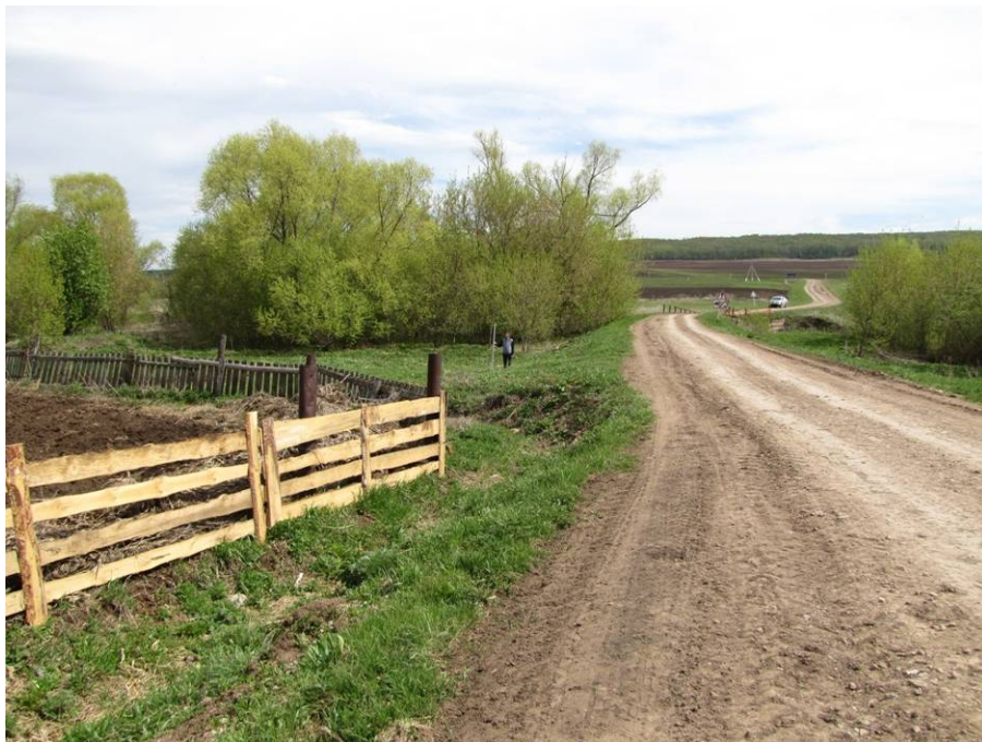
Рис. 3. Общий вид на район проектируемого мостового перехода и место обследования поверхности первой надпойменной террасы правого берега реки Налимка по краю огородов в селе Налим. Вид с северо-запада, от окраины села Налим.