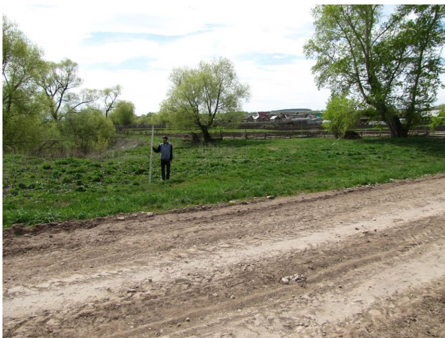
Рис. 4. Разрушенная в результате предшествующего автодорожного строительства поверхность высокой поймы правого берега реки Налим. Вид с востока.