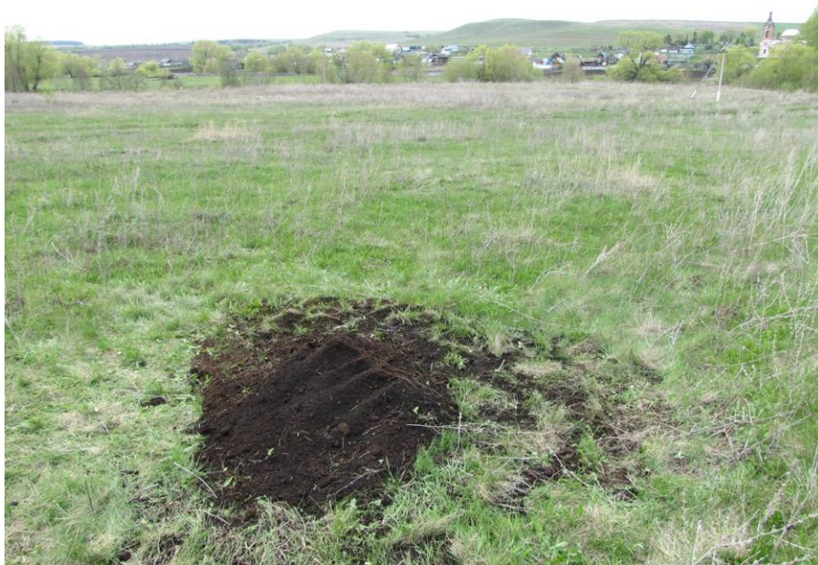
Рис. 9. Шурф № 1. После рекультивации.