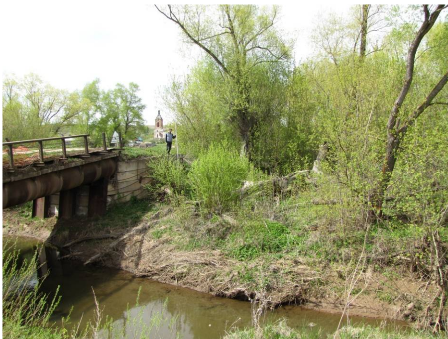
Рис. 5. Разрушенная в результате предшествующего автодорожного строительства поверхность высокой поймы правого берега реки Налим. Вид с юго-востока.